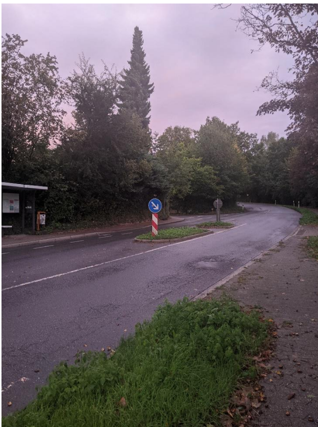
Abb. 2: Bushaltestelle „Kalkumer Feld“ des O5, Fahrtrichtung Alt-Erkrath